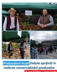
Producătorii locali trebuie sprijiniți în vederea comercializării produselor. © 2020 Uniunea Salvați România